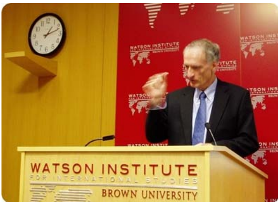
Bertel Haarder sammenlignede det amerikanske sundhedssystem med europæiske sundhedssystemer, da han holdt oplæg på Brown University.

"Set fra et europæisk perspektiv er det forunderligt, at reformen ikke går videre, end den gør, for behovet er der tydeligvis", er den danske minister citeret for at sige i universitetetsavisen The Brown Daily Herald.