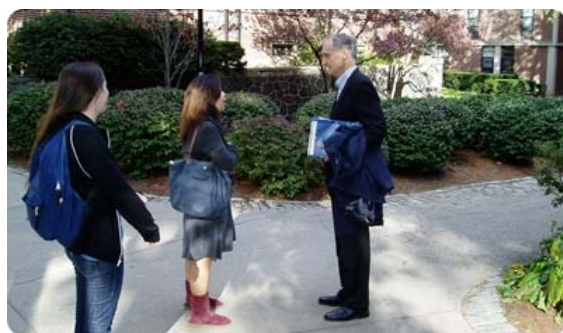
Bertel Haarder bliver vist rundt på Brown University af to studerende.

Her skal han bl.a. besøge Silicon Valley. Og på søndag skal han være med i en sundhedskaravane, hvor han skal cykle over Golden Gate Bridge i San Fransisco.