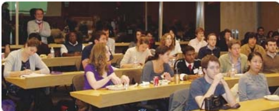
De studerende sad tæt i Joukowsky Forum på Brown University, da Bertel Haarder holdt oplæg. Bagerst til venstre står Italiens tidligere premierminister, Romano Prodi.

Her sad bl.a. Italiens tidligere premierminister Romano Prodi på tilhørerrækkerne. Han er gæsteprofessor på universitetet, og Bertel Haarder inddrog ham i diskussionen.